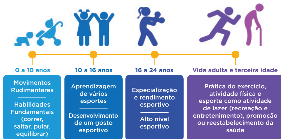
FIGURA 1 Biografia do Esporte.